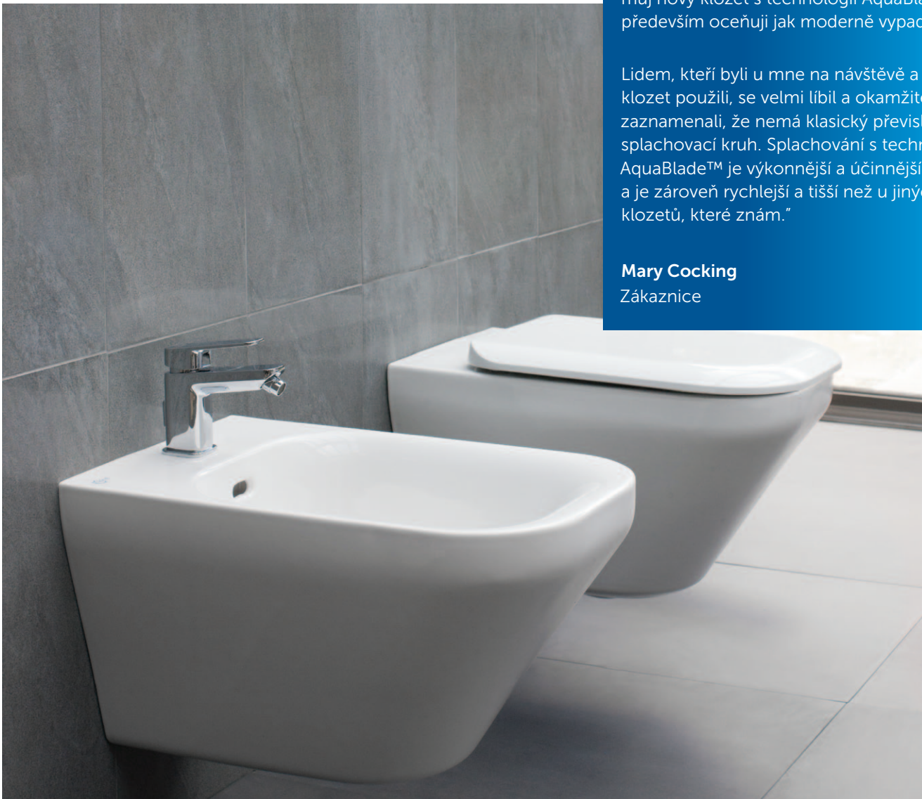
Mary Cocking Zákaznice

Lidem, kteří byli u mne na návštěvě a tento klozet použili, se velmi líbil a okamžitě zaznamenali, že nemá klasický převislý splachovací kruh. Splachování s technologií AquaBlade™ je výkonnější a účinnější a je zároveň rychlejší a tišší než u jiných klozetů, které znám.“